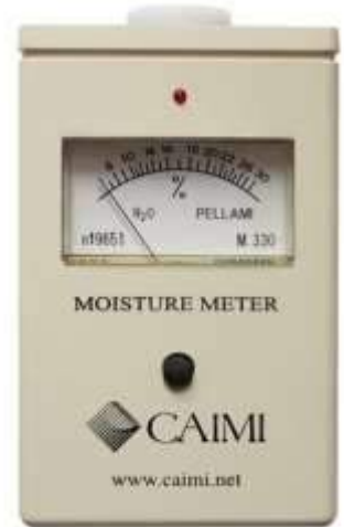
Misuratore di Umidità Analogico